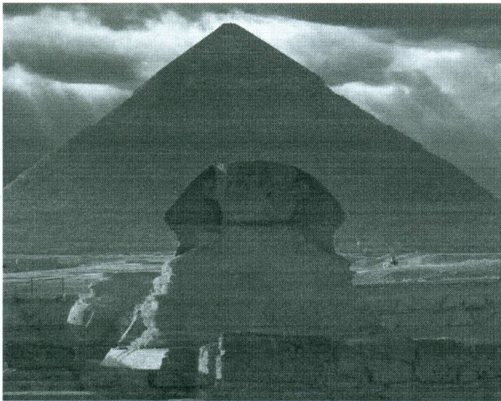
ПИРАМИДА ХЕФРЕМА БОЛЬШОЙ СФИКС ЕГИПЕТ