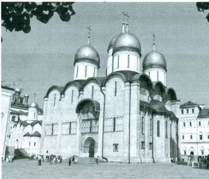
УСПЕНСКИЙ СОБОР Россия