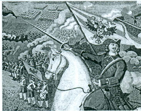
4) Г Полтавская битва 08.07.1709

А) Хан Ахмат собирался на Угре-реке С Казимировой ратью слиться. И осеннею ночью, туманной, густой, На побережье, под город Калугу, Он привел все остатки Орды Золотой.