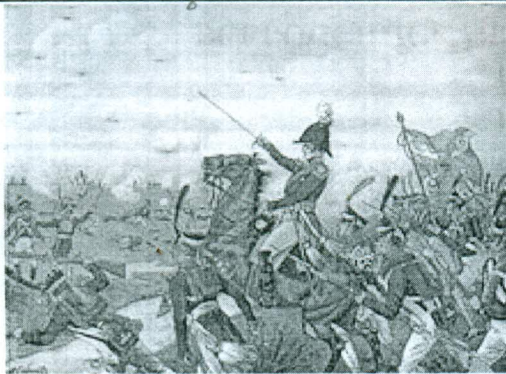
3) В Бородинское сражение 07.09.1812