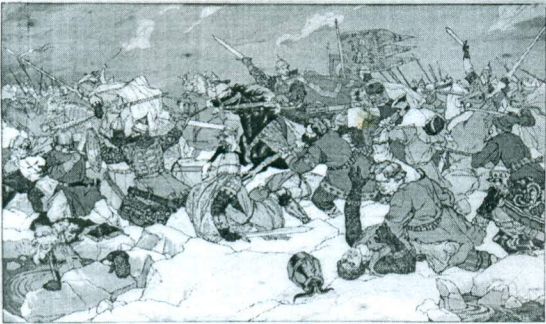
1) Б Ледовое побоище 05.04.1242