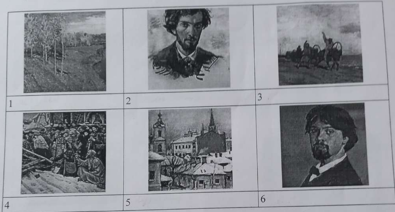
Таблица для ответа

Дан ряд произведений и их названия: «Золотая осень», «Автопортрет», «Бурлаки», «Боярыня Морозова», «Вид на Кремль», «Автопортрет». Сопоставьте названия и картину. Все картины можно разбить на группы. Предложите свои варианты разбивки. Дайте название каждой группе.